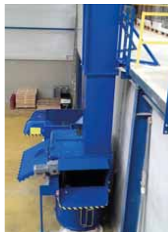
VALPAK se speciální násypkou