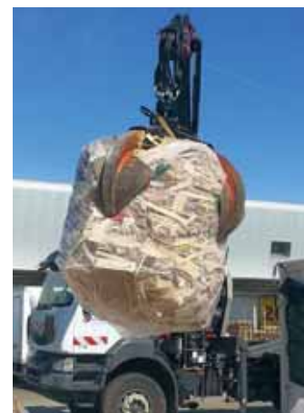
Snadná manipulace hotových balíků